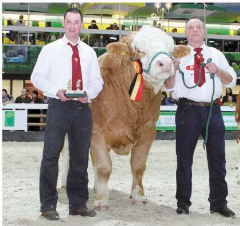
Bundesreservesieger 2012 Berlin ALOIS P (Atlantis P x Lorient P)

Sie wollen beste Genetik, besuchen Sie uns